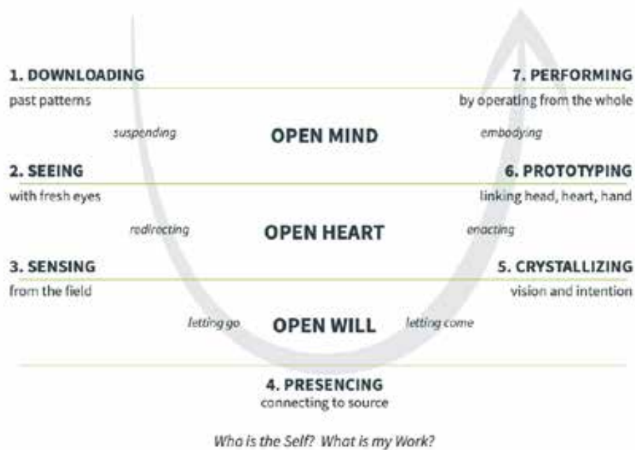
Figuur 2. Theory U

drinken mee voor de hele periode. Afhankelijk van het land loop je van A naar B, of vanuit een hut als uitvalsbasis.